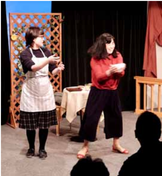
「猫の皿」矢川千尋・清水雅子