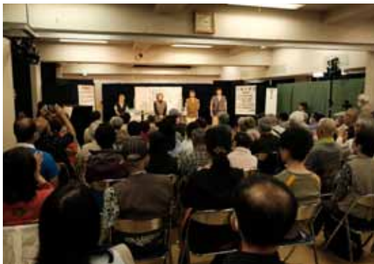
◆正面奥が A 室、手前が B 室と本来は二つの会議室だが、間仕切りを外すと、かなり広い空間となり、劇場となる。

〒184-0003 東京都小金井市緑町 5 丁目 13 番 24 号 TEL 042-381-5165 (代) FAX042-381-6987